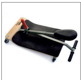
ausilio di seduta