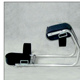
ausilio di seduta