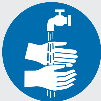
Segnale di obbligo «Lavarsi le mani»