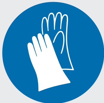
Segnale di obbligo «Usare i guanti di protezione»