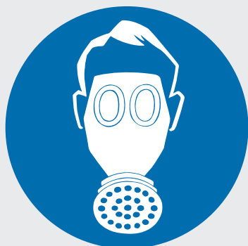
Segnale di obbligo «Proteggere le vie respiratorie»