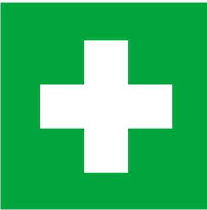
Segnale di pronto soccorso