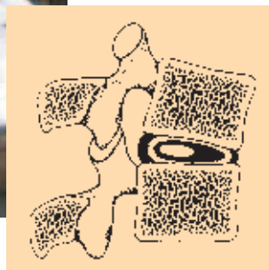
Figura 4 Deformazione dei dischi intervertebrali.