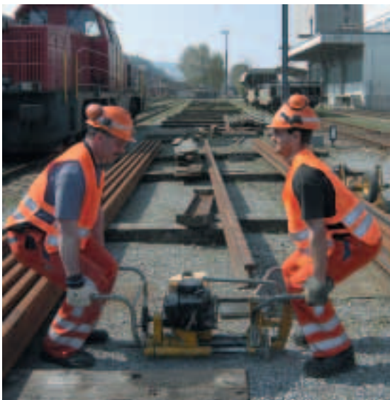
Figura 15 In due va molto meglio.