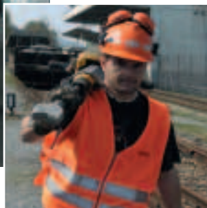
Figura 8 Il modo migliore per trasportare i sacchi e le merci pesanti è appoggiarli sulle spalle, tenendo la schiena ben diritta!

Se avete domande su questo argomento, rivolgetevi al vostro addetto alla sicurezza.