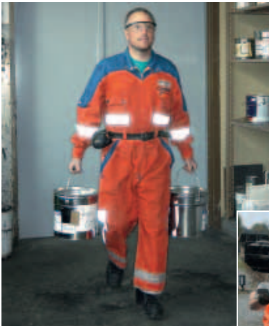
Figura 7 Se possibile, distribuire uniformemente il carico.

Anche quando si depone il carico la regola principale è flettere le gambe e tenere la schiena ben diritta.