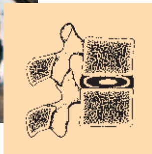
Figura 2 Carico ripartito uniformemente sui dischi intervertebrali.

Anche quando si sollevano pesi leggeri bisogna necessariamente piegare la schiena e questo equivale ad un semplice esercizio di ginnastica. Tuttavia, se il peso supera i 5 kg, dovete prestare particolare attenzione alla posizione del corpo, ossia, bisogna sollevare il carico con la schiena diritta e le ginocchia piegate.