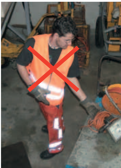
Figura 10 Quando si solleva e si depone un carico bisogna evitare assolutamente la torsione del busto.