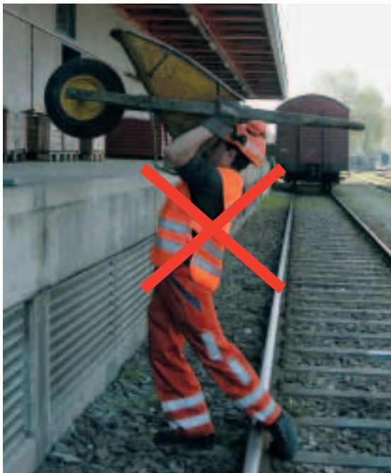
Figura 9 Evitare l'iperestensione della regione lombare. Questo succede quando si pretende troppo dalle proprie forze.