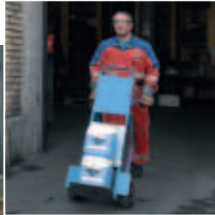
Figura 14 ... un pratico carrello portasacchi.

Se non conoscete l'effettivo peso di un carico, è bene iniziare l'azione di sollevamento facendo un timido tentativo, ma con molta attenzione. Cercate di mantenere la corretta posizione del corpo (figura 5).