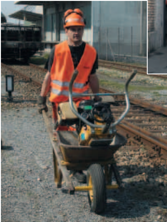
Figura 13 Utilizzate mezzi ausiliari, ad es. una carriola o ...