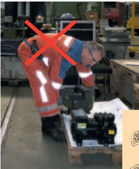
Figura 3 Sollevamento di un carico con la schiena inarcata (tecnica sbagliata).

Se si solleva un carico inarcando la schiena (tecnica scorretta) i dischi intervertebrali vengono deformati e compressi maggiormente sulla parte anteriore che posteriore. Quanto più forte è l'inclinazione del tronco in avanti e pesante il carico, tanto maggiore risulta il carico a danno dei dischi intervertebrali, con conseguenti traumi o lesioni alla schiena.