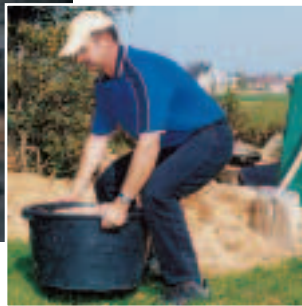
Figura 6 ... così come nel tempo libero.