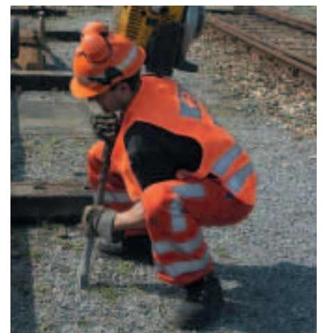
Figure 17 e 18

Chi conosce la corretta tecnica di sollevamento e trasporto o possiede muscoli allenati, ad es. gli sportivi, può sfruttare queste abilità anche sul posto di lavoro.