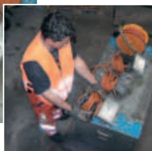
Figura 11 Quando spostate un peso da un lato all'altro, fate sempre un passo intermedio.