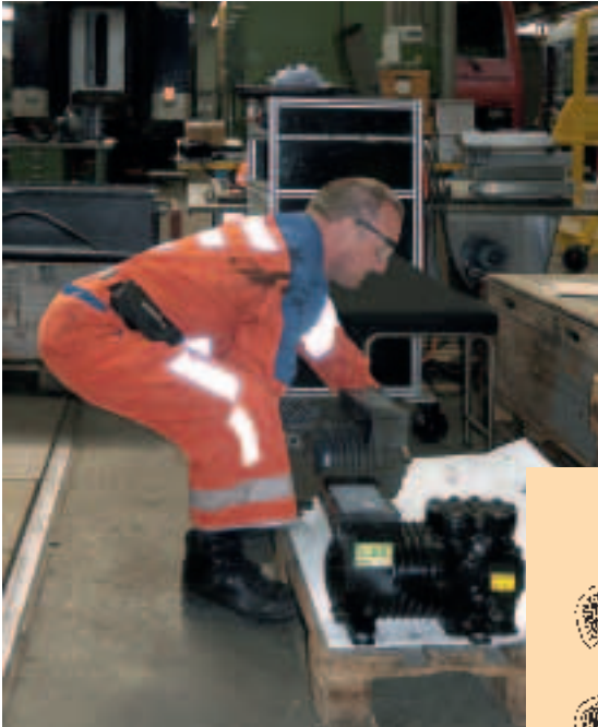
Figura 1 Se la tecnica di sollevamento è corretta la schiena deve essere diritta.