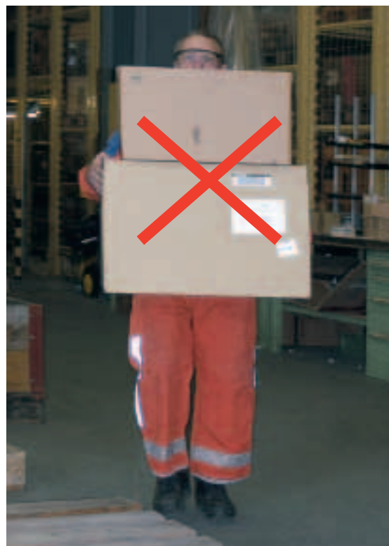
Figura 12 Spesso i pacchi vengono accatastati uno sopra l'altro, bloccando in questo modo la visuale. Attenzione, poiché camminare alla cieca può diventare molto pericoloso. Quindi, fate in modo di avere sempre la visuale libera!