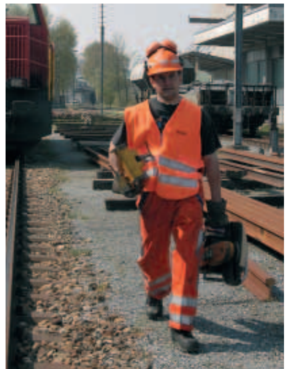
Figura 16 Anche i pesi più leggeri possono diventare faticosi se si devono percorrere tragitti molto lunghi. Pertanto, se il percorso è lungo, è consigliabile suddividere il peso. Ad esempio, se dobbiamo spostare un carico per 20 m, prendiamo solo la metà di quello che avremmo trasportato su una distanza di 2 m. Se il peso non si può dividere, è bene utilizzare un mezzo di trasporto.