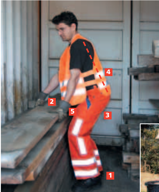
Figura 5 Sollevare i carichi nel modo corretto. Questo vale sul posto di lavoro ...